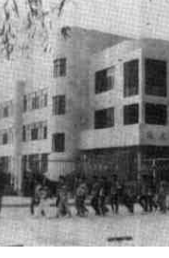
由香港影业公司董事长邵逸夫先生资助50万港币建成的2600平方米的市实验小学“逸夫教学楼”于9月1日正式投入使用。